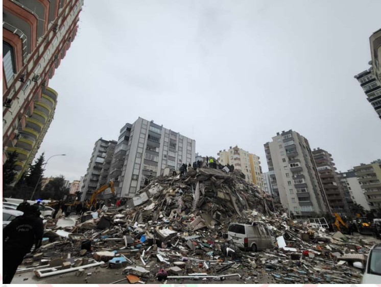
Güzelyalı Semt Pazarı yakınındaki bina 6.02.2023 saat 10.00