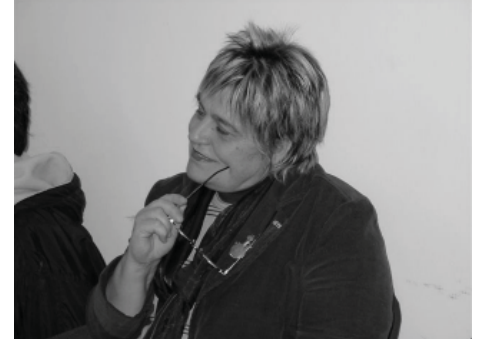
Resim 1: Dr. Füsun SAYEK

2004 yılı içerisinde UDEK bünyesi içerisinde Ulusal Yeterlik Kurulu (UYEK) kuruldu. Dönemin TTB Başkanı Dr. Füsun SAYEK (Resim 1) ve UDEK Başkanı Dr. Cem TERZİ’nin (Resim 2) aktif destekleri ile UYEK kısa bir süre içerisinde kendi yönergesinin oluşturup ilk genel kurulunu yaparak aktif olarak çalışmaya başladı.