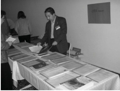
Resim 4: XII. Tıpta Uzmanlık Eğitimi Kurultayı UYEK Standı

ilgili görüş belirtilmiştir. Kurultay sırasında, Yeterlik Kurullarının basılı Yönergeleri, basılı eğitim içerikleri, Tıpta Uzmanlık Öğrencisi Uygulama ve Kredilendirme Defteri örnekleri, Yeterlik Sınavı Başarı Belgelerinin basılı örnekleri, Yeterlik Kurulları tarafından hazırlanan en az girişimler listesi veya müfredat programları, kurum ziyareti programları sırasında kullanılan anketler ve tanıtım duyuruları, el ilanları gibi diğer materyaller UYEK kösesinde sergilenmiş ve ortak paylaşımına sunulmuştur (Resim 4). Ek olarak her bir Yeterlik Kurulunun kendi gelişim süreçlerini, Yeterlik sınav Sonuçlarını ve hedeflerini anlatan bir poster hazırlamaları istenmiş ve yaklaşık 30 kadar poster sunumu gerçekleştirilmiştir (Resim 5).