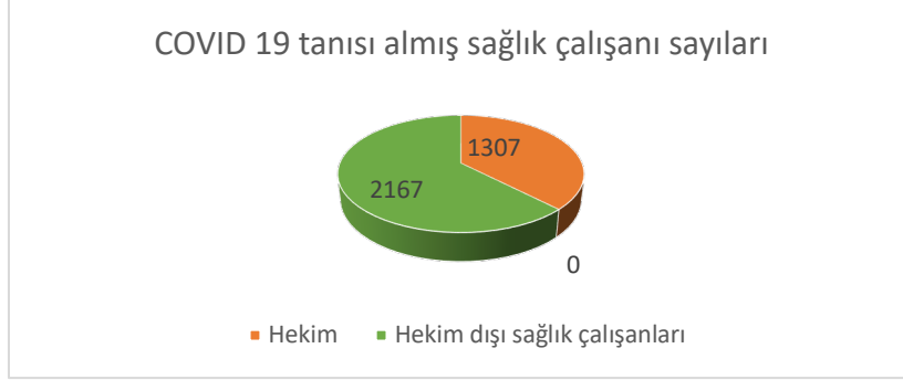
Şekil 1. Hekim ve hekim dışı sağlık çalışanlarının dağılımı

Tanı almış hekim sayısının en yüksek olduğu iller İstanbul, İzmir, Ankara, Eskişehir ve Adana'dır (Şekil 2). İstanbul'da 960'ı hekim olmak üzere toplam 2005 sağlık çalışanının hastalığa yakalandığı bilgisine ulaşılmıştır. Bu illeri sırasıyla 12 sağlık çalışanı ile Diyarbakır, 11 ile Kırklareli, 11 ile Antalya, 10 ile Bursa, 9 çalışan ile Samsun izlemektedir.