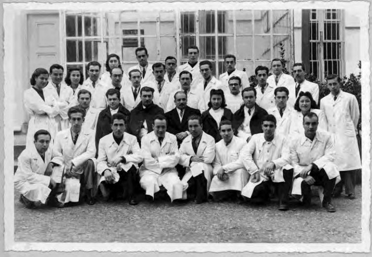
Ankara Numune Hastanesi