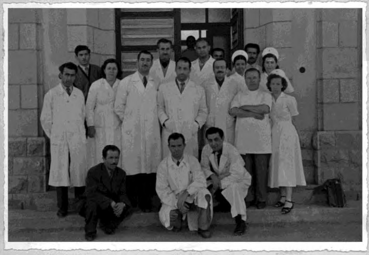
Turhal Şeker Fabrikası