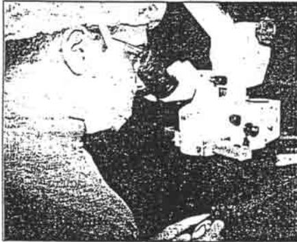
'da katarakt ameliyatları son teknoloji lazerli-dikişsiz yöntem FAKO ile yapıyor.