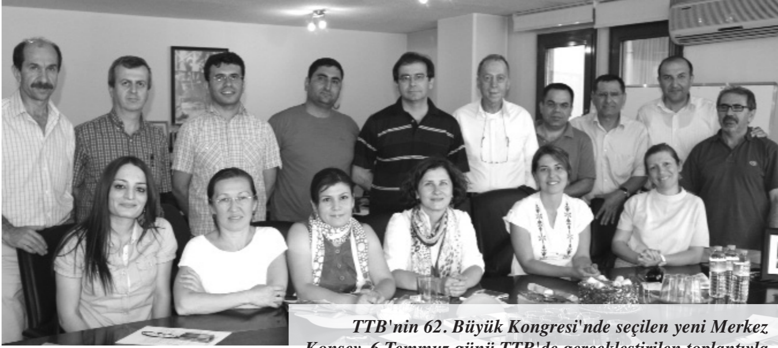
TTB'nin 62. Büyük Kongresi'nde seçilen yeni Merkez Konsey, 6 Temmuz günü TTB'de gerçekleştirilen toplantıyla