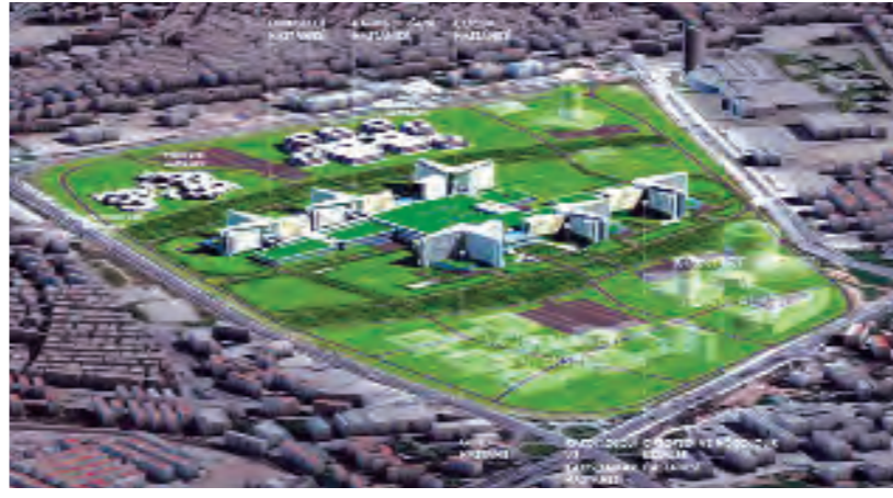
Kompleks, Kamu Özel Ortaklığı Daire Başkanlığı'nın sitesinde yer alan bilgilere göre; , 1 milyon 400 bin metrekare alan üzerine inşa edilecek.

Kampus içerisinde ayrıca, Sağlık Bilimleri Üniversitesi, kongre merkezleri ve ti-